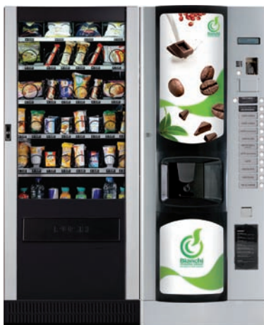
LEI 400 & BVM 676